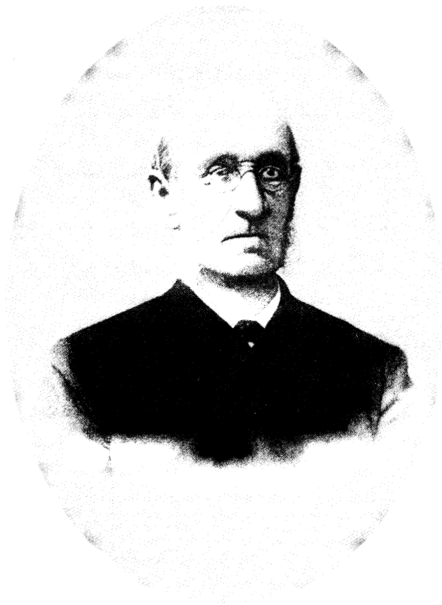
Константин Федорович Голстунский 1831—1899